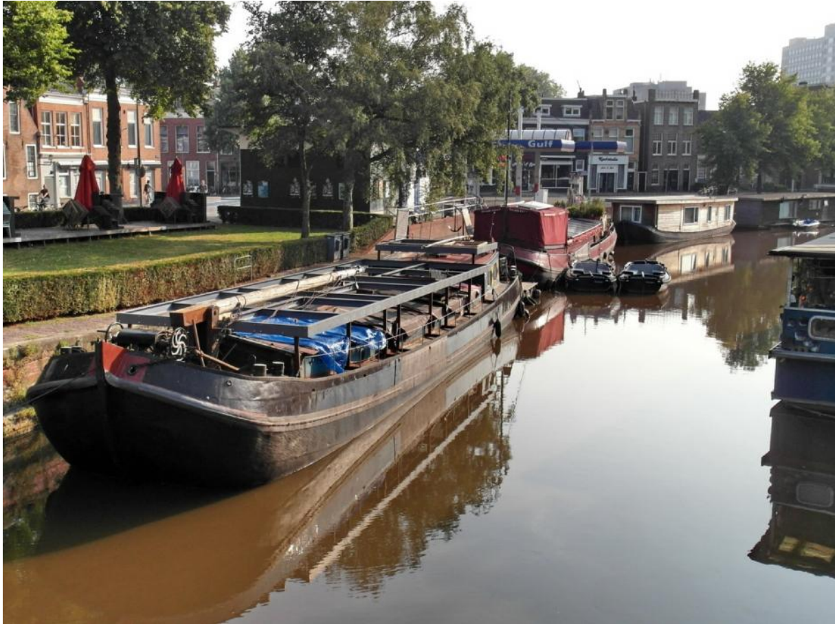
Figuur 5 - De stalen constructie zal de contactgeluiden van het terras perfect in de voormalige woning doorgeven