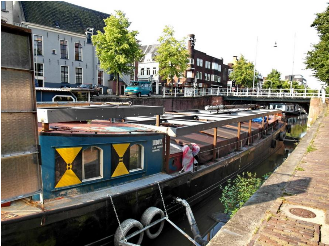
Figuur 4 - Het schip verdwijnt zowat