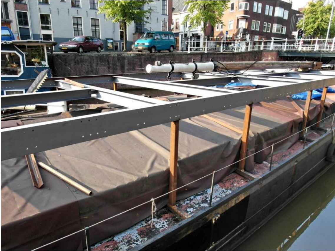
Figuur 3 - Detail van de zware constructie