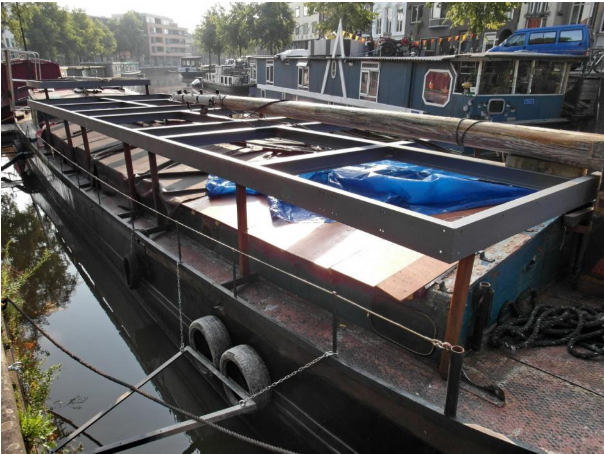
Figuur 2 - De zware constructie