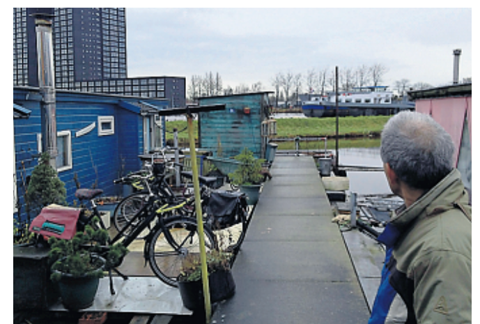
Een vrachtschip passeert in het Eemskanaal.