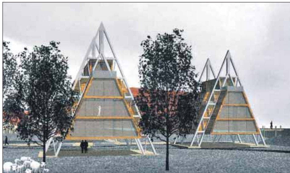
Het prijswinnende plan voor de woonschepenhaven.

Door de steigers waaraan de schepen liggen te verhogen en te verbreden, en daar de woonloodsen aan te bouwen, willen de architecten een soort podium