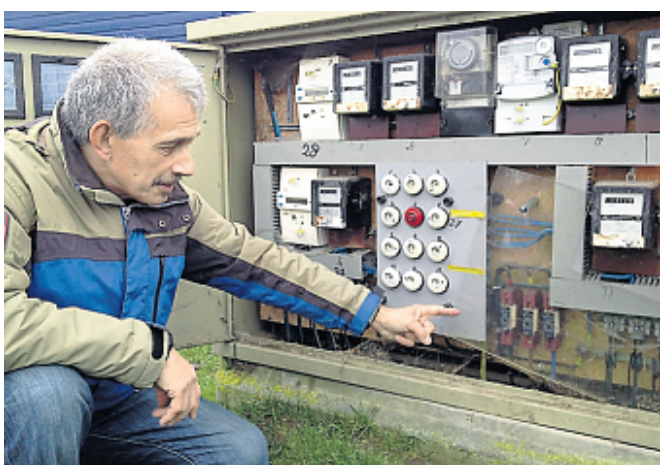
Verouderde installaties: "Iemand heeft al eens een optater gehad."