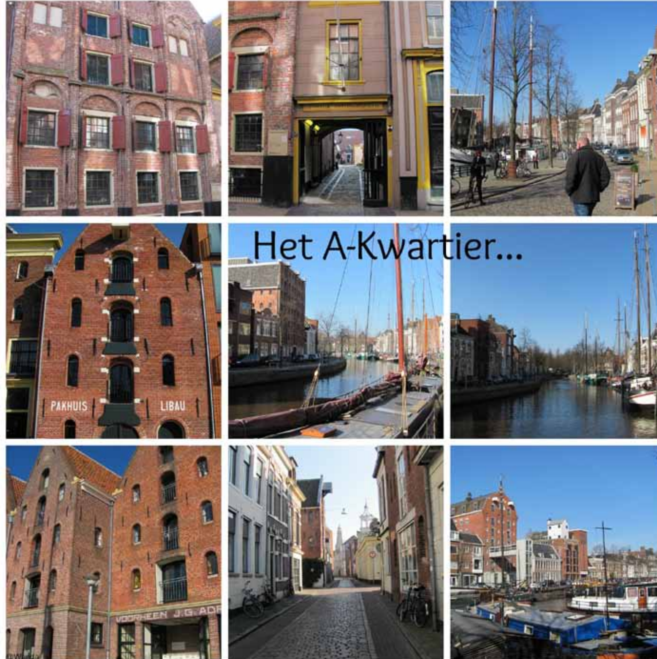
Het A-Kwartier is het gebied tussen de Oude Boteringestraat en Hoge der A en kenmerkt zich door verscheidene universiteitspanden, allerlei pleintjes, steegjes, plekken waar vroeger de oude Middeleeuwse muur stond, het havengebied, oude pakhuizen en bierbrouwerijen. @wiebie74