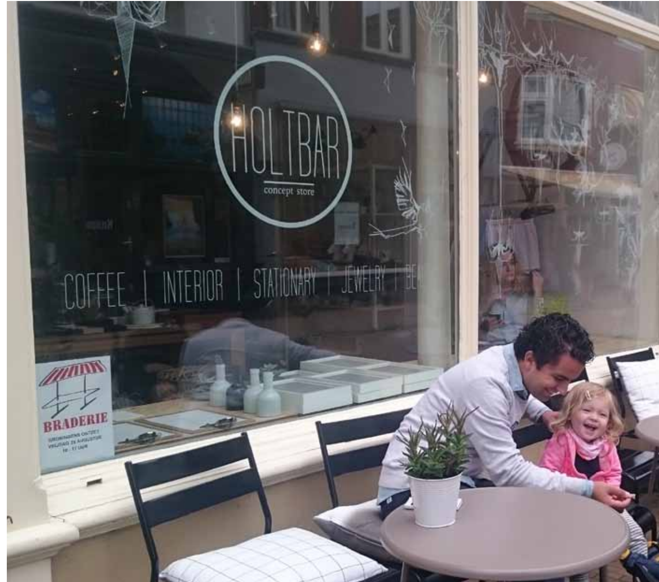
Conceptstore in Oude Kijk in 't Jatstraat