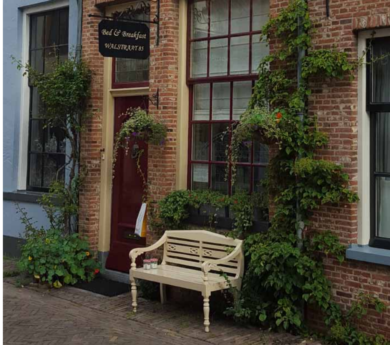
B&B met groene gevel en bank (Walstraat, Deventer)

De planten groeien of vanuit potten of zo uit de stoep, bij de gevels omhoog. Ze worden onderhouden, maar kunnen wel vrij groeien. De afwisseling versterkt het beeld. Bepalend hierbij zijn soort, omvang, positie, wel of niet in pot.