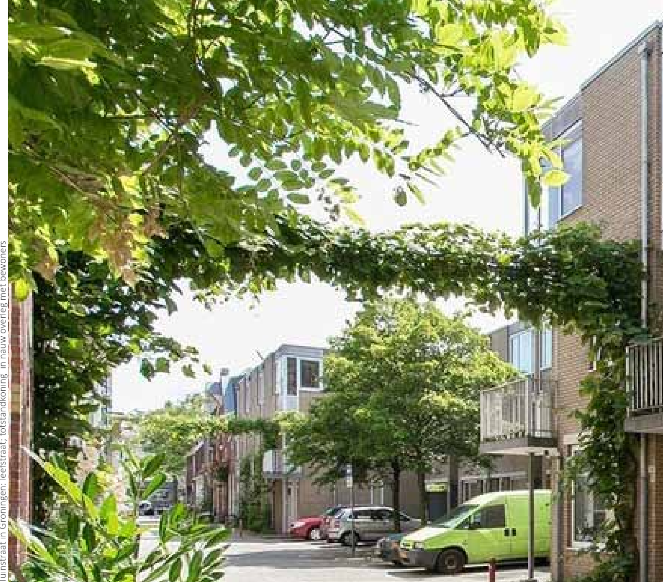
Tuinstraat in Groningen: leefstraat; totstandkoning in nauw overleg met bewoners