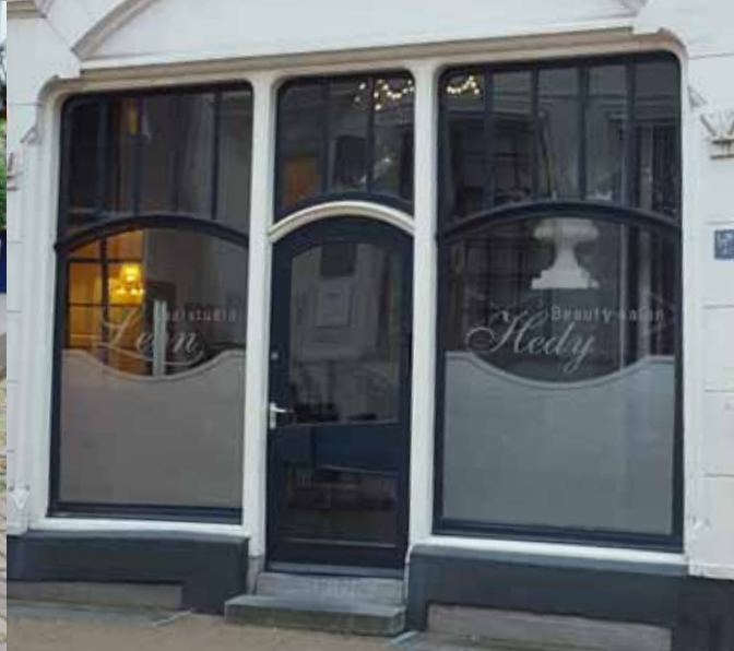
kwaliteit door uitstraling