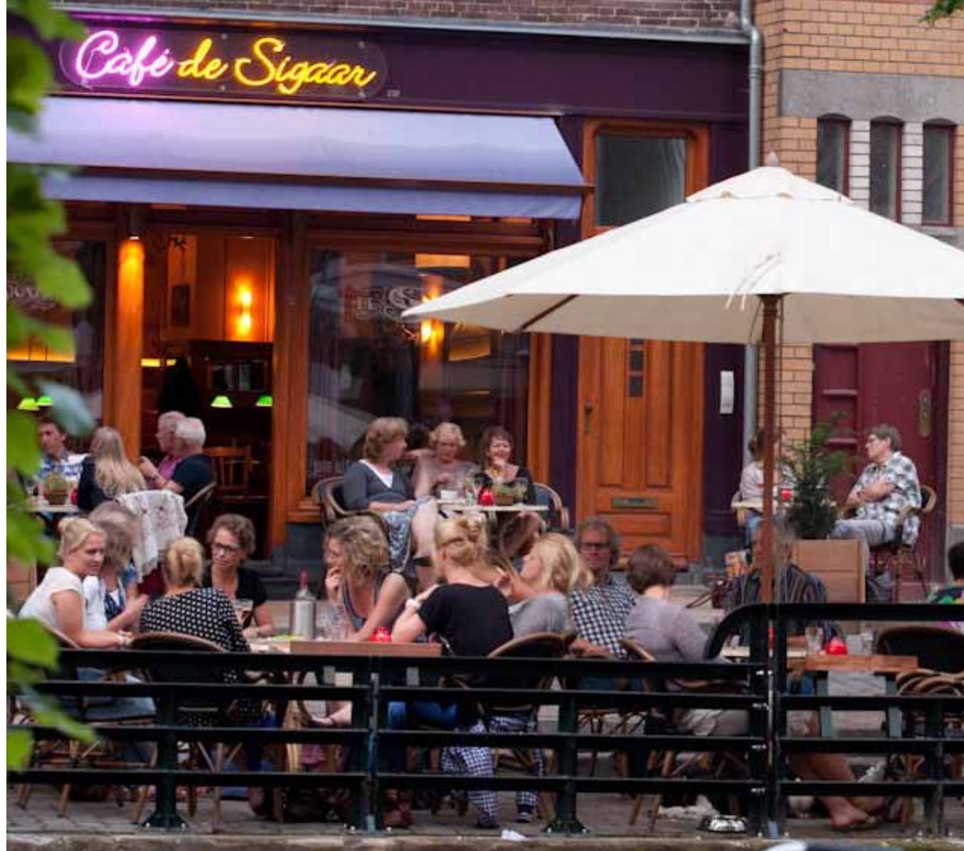
Stoep terras en terras aan het water, aan het eind van de middag (Hoge der A)