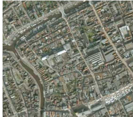
luchtfoto A+ kwartier en directe omgeving

De focus ligt op een kleiner gebied. In dit gebied liggen de Derde, Vierde en Vijfde Drift, de Vishoek, de Hoekstraat, de Muurstraat en de Visserstraat.