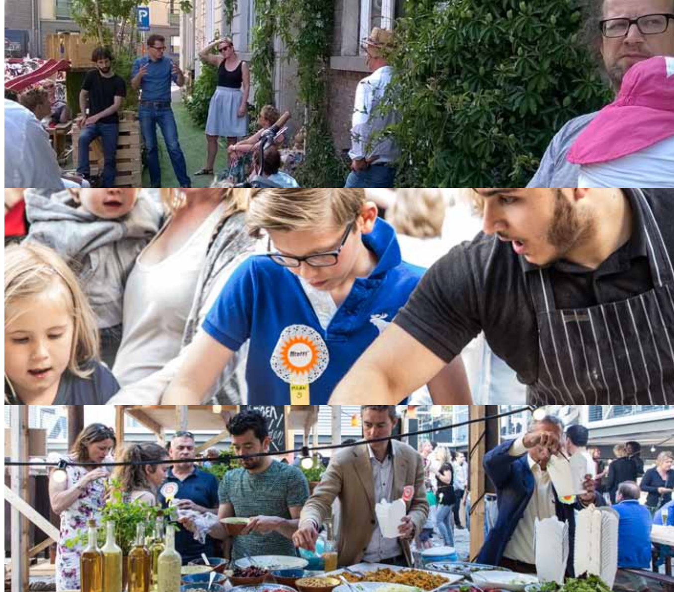
verscheidenheid maakt A+ kwartier