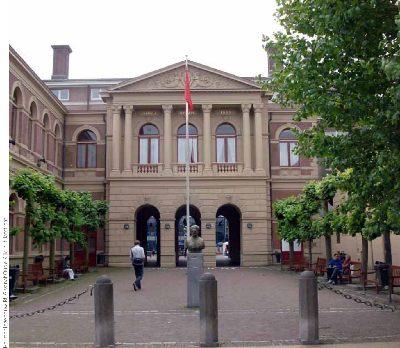
Harmoniegebouw RUG vanaf Oude Kijk in 't Jatsstraat

Stad en universiteit hebben hier een belangrijke troef in handen om de creatieve kenniseconomie van (internationale) kenniswerkers en studenten, (internet)start-ups en leisure te faciliteren. Hun aanwezigheid levert zelf weer een stimulans op voor de groei en bloei ervan, inclusief extra arbeidsplaatsen. Kenniswerkers zijn het meest succesvol in gebieden met een aangenaam verblijfsklimaat. Een stad met veel ruimte voor de voetganger met een compleet en kwalitatief goed aanbod van stedelijke voorzieningen op loop- en fietsafstand van huis en werk. Op deze ontwikkeling spelen het A + kwartier, universiteit en gemeente graag in.