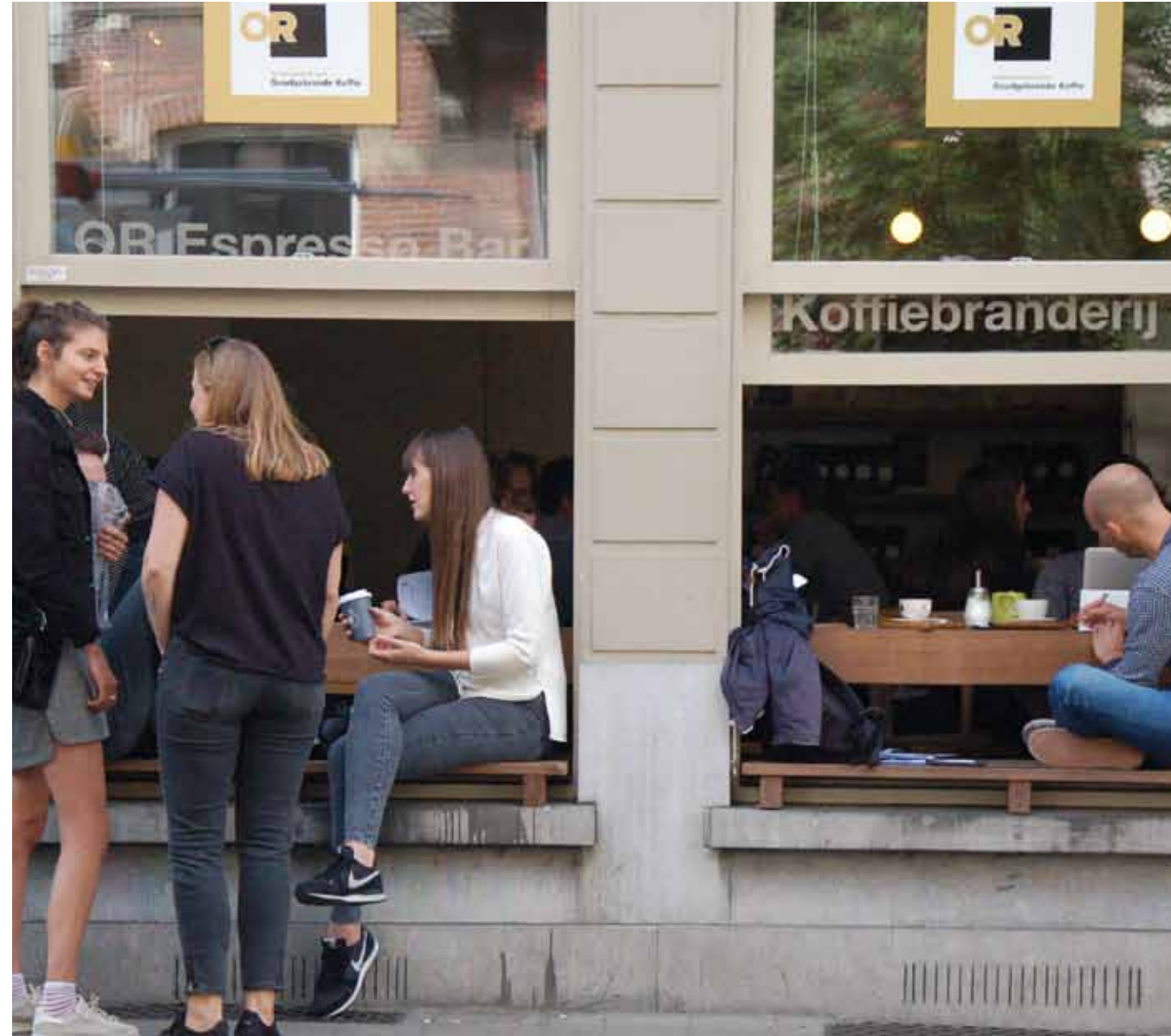
Ontmoetingen in open vensters, Koffiebranderij, Gent

De panden binnen de plangebiedsgrens van het (ontwerp) Bestemmingsplan Vishoek, Hoekstraat en Muurstraat hebben in de Toekomstvisie A + kwartier een bijzondere status. Voor het renoveren en/of vernieuwen van deze panden zal, om een versnelling in de eerste jaren te bewerkstelligen, een tijdelijke stimuleringsmaatregel van toepassing zijn.